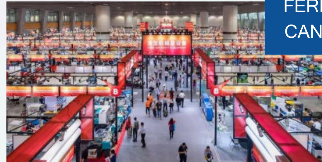
FERIA DE CANTÓN